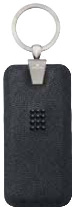
KEY RING cod. SW5434792 - € 39.00

Il porta-carte di lusso con fermasoldi unisce una grande funzionalità all'elevato stile della pelle di vitello nera di qualità superiore, costellata di luccicanti cristalli Swarovski Jet. Sulla parte posteriore troverete un fermaglio liscio in acciaio inossidabile su cui è inciso il logo con il cigno Swarovski, suo accreditato marchio di qualità.