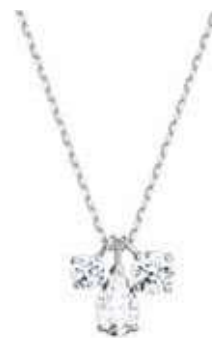
ATTRACT PENDANT CLUSTER cod. SW5571077 - € 85.00

Fondi eleganza e semplicità con la collana Attract. Intramontabile ed elegante, il design placcato nella tonalità oro rosa presenta una brillante pietra dal taglio quadrato. Ideale per ogni occasione, è un “must” immancabile in ogni collezione di gioielli e perfetta da regalare. Il gioiello è altamente armonizzabile con altre creazioni Swarovski.