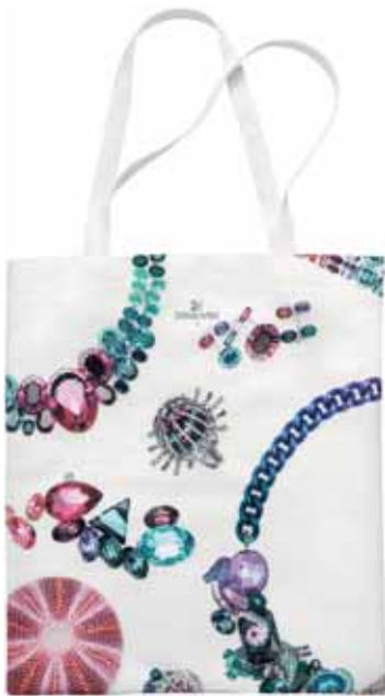
TOTE BAG WITH PATTERN cod. SW5247183 - € 29.00

Questa borsa shopper di alta qualità è la compagna perfetta per le spese di ogni giorno, oltre che un'eccellente idea regalo. Realizzata in cotone poliestere, presenta elementi statement delle collezioni di gioielli Swarovski. 40 x 35 cm.