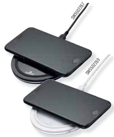
WIRELESS CHARGER cod. SW5502269 - SW5502267 - € 45.00

Nuovissima idea per un regalo elettronico, il cavo USB presenta due perline di acciaio inossidabile, un ciondolo rosa e un ciondolo patinato con il logo Swarovski, infilate sul suo alimentatore in poliuretano rivestito di pelle nera. Un originale elemento decorativo su un dispositivo funzionale di uso quotidiano che conferisce un gradito tocco scintillante alla vita di tutti i giorni. Un'utile aggiunta al cavetto principale è rappresentata da un connettore più un cavo reversibile USB micro B e un cavo USB di tipo C, che consentono di fornire più rapidamente maggior energia e permettono così al cavo USB di soddisfare tutte le esigenze. Il logo con il cigno Swarovski impresso sul connettore conferma che si tratta di un articolo di alta qualità.