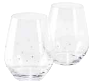
WATER GLASS, SET OF 2 cod. SW5468810 - € 49.00

Questi eleganti bicchieri per Martini di produzione tedesca sono disponibili in set da due pezzi, ciascuno dei quali misura circa 17,5 x 12 cm. Vengono impreziositi in Austria con i cristalli e presentano il logo Swarovski impresso grazie alla tecnica della sabbiatura. La coppia di bicchieri può anche essere personalizzata con un logo o un simbolo a vostra scelta. Un modo memorabile per brindare al successo, o semplicemente per aggiungere un tocco di stile alla vostra casa.