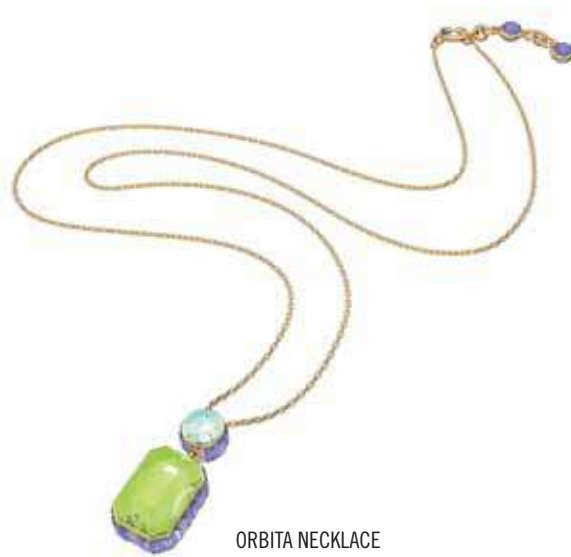
ORBITA NECKLACE cod. SW5619787 - € 135.00

In questa collana double-face convergono tinte armoniose di verde intenso, lilla e Colorado Topaz. Presenta due cristalli focali: una pietra round e un cristallo più grande taglio Drop, che ruota per consentirti di indossarla su entrambi i lati. Montato su una raffinata catenina placcata rodio, questo gioiello elegante darà un tocco elegante a qualsiasi look, sia indossato da solo sia abbinato ad altre creazioni. Parte della famiglia Orbita, questa collana è ideata dalla Direttrice Creativa Giovanna Engelbert per la Collection III.