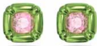
DULCIS STUD EARRINGS cod. SW5600778 - € 135.00

Questo choker di impatto brilla come un prisma destrutturato. Presenta un mix di audaci pietre acquamarina, un'elegante placcatura rodio e una raffinata chiusura nascosta. Raffinato ma con un'inegabile audacia, questo girocollo è il gioiello perfetto sia di giorno che di sera. Parte della famiglia Harmonia, questo choker è firmato dal Direttore Creativo Giovanna Engelbert per la Collection I. Come chiuderla e aprirla: posizionare l'elemento di fissaggio nel punto più largo del foro opposto e farlo scorrere fino al punto più basso. Una volta posizionato, abbassare il fermo di sicurezza dell'anello a D sulla parte superiore per bloccare il fissaggio. Per aprire, sollevare il fermo di sicurezza dell'anello a D e far scorrere il testimone verso il punto più largo per sganciarlo.