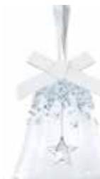
CLASSIC BELL ORNAMENT STAR S cod. SW5545500 - € 55.00

Quest'anno, rendi perfetto il tuo albero con questo superlativo Puntale per Albero di Natale in cristallo. La sua combinazione unica e bellissima di vetro soffiato a bocca e minuti cristalli applicati a mano rende ogni creazione un gioiello irripetibile. La sua leggerezza lo rende ideale anche per alberi di piccole dimensioni. Oggetto decorativo. Non è un giocattolo. Non adatto a bambini di età inferiore ai 15 anni.