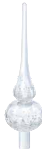
CHRISTMAS TREE TOPPER cod. SW5301303 - € 119.00

Questo Soggetto in Cristallo Babbo Natale di Swarovski porta con sé scintillanti doni. Realizzato con amore in scintillante cristallo rosso e Clear Crystal, tiene in mano un regalo in cristallo verde rifinito con un fiocco rosso e un sacco in cristallo colmo di meraviglie. Tra gli stivali in cristallo grigio e il glaciale cristallo bianco della barba e del viso, Babbo Natale brilla con 603 sfaccettature. Una deliziosa decorazione per far risplendere ogni casa e una festosa e affascinante idea regalo. Oggetto decorativo. Non è un giocattolo. Non adatto a bambini di età inferiore ai 15 anni.