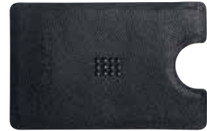
CARD HOLDER MONEY CLIP cod. SW5434793 - € 45.00

Questo porta carte di credito e biglietti da visita in pelle di vitello italiana di qualità rappresenta un regalo utile e sofisticato. Questo articolo presenta una particolare trama della pelle ricoperta da un motivo "Crystal" appositamente creato per Swarovski. Un omaggio veramente unico nel suo genere, decorato con l'iconico motivo del cigno stampato in rilievo ed impreziosito con cristalli Swarovski.