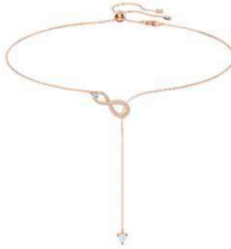
INFINITY NECKLACE Y cod. SW5521346 - € 135.00

Presentiamo una nuova straordinaria interpretazione del nostro pendente Solitaire bestseller, uno dei nostri design più popolari e un vero classico Swarovski. Più raffinato che mai, questo pendente rodiato emana un finissimo scintillio. Un gioiello immancabile, dotato del giusto grado di scintillio adatto ad ogni occasione, farà risplendere ogni outfit. Il pendente è abbinato a una catenina.