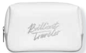
MAKE-UP POUCH BRILLIANT TRAVELER cod. SW5502272 - € 19.00

Realizzato in pelle PU, il motivo è disegnato dalla famosa blogger e influencer globale Margaret Zhang e presenta elementi statement delle collezioni di gioielli Swarovski. 21 x 15 x 1,5 cm