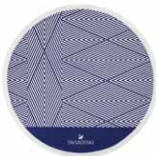
BEACH TOWEL cod. SW5358075 - € 29.00

Le borse da spiaggia richiamano alla mente il ricordo di giornate spensierate trascorse al sole, ma questa borsa bianco e blu in stile marinaro è un regalo così utile che porterà sicuramente un tocco estivo alla vita di tutti i giorni. Realizzata in pratico canvas poliestere, questa ampia borsa (38 x 29,5 x 17 cm) ha un borsello interno e brilla con quindici cristalli Swarovski® e un logo Swarovski stampato in argento.