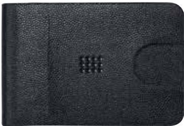
WALLET WITH MONEY CLIP cod. SW5434794 - € 49.00

Fatto di pelle di vitello di eccellente qualità, con la parte anteriore costellata di 12 cristalli Swarovski Jet, questo portafoglio nero classico con fermasoldi, praticissimo oltre che dotato di molta classe, luccica delicatamente. All'interno, custodie che offrono posto per diverse carte di credito e in più un fermaglio liscio e lucente in acciaio inossidabile, con il logo del cigno Swarovski inciso al laser sul retro, vengono a completare questo elegante pezzo dall'aerodinamico design. Un articolo elegante e un regalo estremamente attraente.