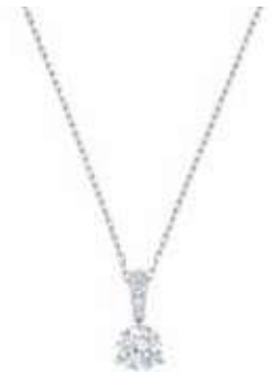
SOLITAIRE PENDANT cod. SW5472635 - € 115.00

La bellezza della luna e delle stelle è interpretata splendidamente da questa elegante e romantica collana placcata oro rosa. Carica del simbolismo del cristallo nelle tonalità chiare e scure, questa creazione, che si ispira all'astronomia, ha un aspetto bohémien e lussuoso. Perfetta per creare sovrapposizioni con altre collane della tua collezione, puoi anche accessoriarla con il bracciale e l'anello abbinati.