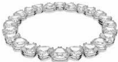
MILLENIA NECKLACE cod. SW5599167 - € 600.00

Questa collana senza tempo rappresenta un elemento di classe in più per il tuo guardaroba quotidiano. Con i suoi voluminosi cristalli trasparenti taglio Trillion inseriti in un'elegante montatura placcata rodio, è un esempio splendido di temeraria semplicità. Indossala per valorizzare il colletto della camicia di giorno, oppure un abito raffinato la sera. Parte della famiglia Millenia, la collana è firmata dal Direttore creativo Giovanna Engelbert per la Collection I. Come chiuderla e aprirla: posizionare l'elemento di fissaggio nel punto più largo del foro opposto e farlo scorrere fino al punto più basso. Una volta posizionato, abbassare il fermo di sicurezza dell'anello a D sulla parte superiore per bloccare il fissaggio. Per aprire, sollevare il fermo di sicurezza dell'anello a D e far scorrere il testimone verso il punto più largo per sganciarlo.