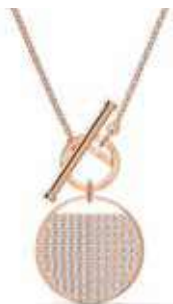
GINGER NECKLACE T BAR cod. SW5567529 - € 115.00

Questo pendente Swarovski sfoggia un tocco di creativa maestria artigianale. È decorato con tre pietre bianche scintillanti: l'elemento centrale, a forma di goccia, è meravigliosamente completato da due pietre rotonde più piccole. Delicate sfaccettature creano un look semplice ma anche raffinato, perfetto per impreziosire gli outfit da tutti i giorni. Il pendente è abbinato a una catenina coordinata ed è ideale da abbinare a gioielli simili.