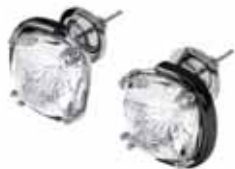
HARMONIA PIERCED EARRINGS cod. SW5600943 - € 115.00

Questi voluminosi orecchini a lobo sono realizzati con cristalli trasparenti taglio Cushion con montatura sospesa a griffe, per realizzare un illusorio effetto fluttuante. Intramontabili e ultramoderni al tempo stesso, puoi indossarli con capi athleisure per il giorno, oppure su abiti da sera eleganti: tocca a te decidere. Questi orecchini sono parte della famiglia Harmonia e sono firmati dal Direttore creativo Giovanna Engelbert per la Collection I.