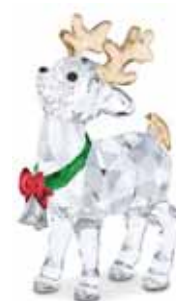
JOYFUL SANTAS REINDEER cod. SW5532575 - € 125.00

Questa Decorazione Pallina di Swarovski cattura i ricordi d'infanzia con dettagli ricchi d'amore. All'interno di una sfera aperta realizzata a mano in vetro soffiato a bocca, siede uno scintillante orsacchiotto di cristallo accanto a un festoso albero di Natale, con cristalli nei tradizionali colori del verde e del rosso. Lo scintillio delle 621 sfaccettature del cristallo è amplificato dal nastro bianco e dai delicati fiocchi di neve stampati all'esterno della sfera, che rifiniscono il festoso quadretto creando un meraviglioso paesaggio invernale. Un affascinante oggetto che aggiungerà un tocco di sentimento alla tua gamma di decorazioni e sarà perfetto da regalare. Oggetto decorativo. Non è un giocattolo. Non adatto ai bambini di età inferiore a 15 anni.