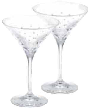
MARTINI GLASS, SET OF 2 cod. SW5532003 - € 69.00

Per brindare al successo con colleghi, clienti e soci, godetevi un buon vino in questi eleganti flûte di cristallo. Disponibile in confezioni di due unità, ogni scintillante flûte è cosparso di 40 cristalli Swarovski che la ornano con un delicato effetto "spray". Questi splendidi bicchieri di 6,8 cm x 21,9 cm saranno anche elementi di decorazione perfetti che, esposti su uno scaffale o sulla mensola di un caminetto, faranno scintillare tutta la stanza. Fabbricati in Germania, vengono poi decorati in Austria e sfoggiano l'emblematico cigno Swarovski, delicatamente applicato con una tecnica di sabbiatura.