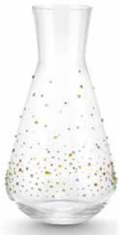
WATER CARAFE, LIME EDITION cod. SW5561858 - € 89.00

Festeggiate i vostri momenti speciali con questo attualissimo porta-champagne in neoprene, elegantemente decorato con cristalli Swarovski. Dimensioni: 9x31 cm.