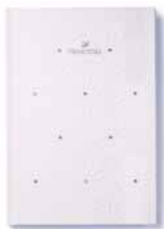
FACETS NOTEBOOK, WHITE cod. SW5531341 - € 29.00

È importante rimanere idratati senza aumentare l'enorme volume di plastica monouso che viene ad accrescere le montagne di rifiuti prodotte ogni giorno dalla nostra società. Ecco perché l'elegante thermos in acciaio inox Crystal è un'indispensabile compagna nella vita quotidiana che tutti apprezzeranno. Progettata per mantenere le bevande calde oppure fredde a seconda del bisogno, è pratica e robusta, con un filtro integrato come utile caratteristica per le tisane. Inoltre, l'elegante silhouette, impreziosita da 15 cristalli scintillanti e trasparenti, ne fa un accessorio di stile da portare nella borsa. Da notare il logo con il cigno Swarovski, rinomato marchio di qualità superiore.