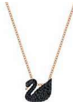
ICONIC SWAN PENDANT, S cod. SW5204133 - € 75.00

Progettata per assumere una strepitosa forma ottagonale, questa collana ciondolo diventerà uno degli accessori più utilizzati del tuo guardaroba. Una delicata catena placcata rodio trattiene una pietra taglio a Step trasparente che si muove mentre la indossi ed è incorniciata da pietre taglio brilliant più piccole. Infinitamente versatile, indossala con una t-shirt bianca per trasmettere sottilmente un messaggio, oppure portala a strati con altre collane, per un look più spettacolare. Parte della famiglia Millennia, la collana è firmata dal Direttore Creativo Giovanna Engelbert per la Collection I.