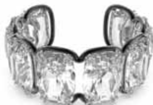
HARMONIA CUFF cod. SW5600039 - € 400.00

Questi orecchini pendenti sono realizzati con file di pietre taglio Cushion, alloggiata su moderne montature a griffe placcate rodio Raffinati e appariscenti al tempo stesso, sanno lasciare il segno con un design intramontabile per essere il gioiello ideale da indossare in ogni occasione. Abbinati ad un semplice capo nero a dolcevita per esaltare le loro forme fluide in stile scultoreo. Parte della famiglia Harmonia, gli orecchini sono firmati dal Direttore Creativo Giovanna Engelbert per la Collection I.