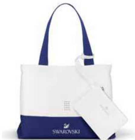
BEACH BAG cod. SW5358072 - € 29.00

Questa brillante custodia per passaporti è un regalo perfetto per il viaggiatore di stile. Comprende quattro pratici intagli per le carte di credito ed è un accessorio non solo alla moda ma anche molto utile, che permette di proteggere il passaporto da eventuali danni. Realizzato in pelle PU bianca, misura 10,5x14 cm e ha una fodera con il motivo "Swan flower". In copertina appaiono il logo Swarovski e l'iscrizione "Brilliant Traveler", applicata utilizzando una tecnica con foglio argentato e ornata con due luccicanti cristalli.