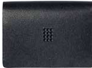
BUSINESS CARD HOLDER cod. SW5468808 - € 45.00

Fatto di pelle di vitello di eccellente qualità, con la parte anteriore costellata di 12 cristalli Swarovski Jet, questo portafoglio nero classico con fermasoldi, praticissimo oltre che dotato di molta classe, luccica delicatamente. All'interno, custodie che offrono posto per diverse carte di credito e in più un fermaglio liscio e lucente in acciaio inossidabile, con il logo del cigno Swarovski inciso al laser sul retro, vengono a completare questo elegante pezzo dall'aerodinamico design. Un articolo elegante e un regalo estremamente attraente.