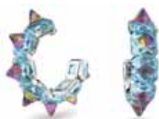
ORTYX HOOP EARRINGS cod. SW5600894 - € 250.00

Realizzato da voluminosi cristalli rosa taglio Trillion montati a griffe con placcatura rodio, questo bracciale straordinariamente chic non passerà inosservato. Completo di chiusura nascosta e di catena di sicurezza ispirata all'alta gioielleria, questo bracciale è un must-have del tuo guardaroba, che aggiungerà un tocco di colore a una semplice maglietta bianca o un pizzico di eleganza ad una felpe con manica tirata su. Parte della famiglia Millenia, questo bracciale è firmato dal Direttore Creativo Giovanna Engelbert per la Collection I. Come chiuderlo e aprirlo: far scorrere i ganci nei corrispondenti fori alla base dell'ultimo cristallo e premere per incastrarli. Fissare la catena di sicurezza utilizzando la piccola chiusura a leva. Per aprire, sganciare la catena di sicurezza e premere contemporaneamente i pulsanti su entrambi i lati della pietra per rilasciare i ganci.