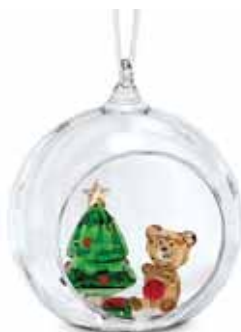
JOYFUL BALL ORNAMENT CHRISTMAS SCENE cod. SW5533942 - € 95.00

Questo bracciale di cristallo è una moderna interpretazione dei tradizionali bracciali con bead e del loro simbolismo. Realizzato con cristalli verdi taglio square e rifinito con un cordino regolabile in cotone cerato, ha il simbolo della pace stampato, simbolo di armonia e concordia. Dona allegria e positività alla tua collezione di gioielli grazie a questo bracciale creato per rendere speciale la tua quotidianità. Parte della famiglia Letra, questo bracciale è ideato dalla Direttrice Creativa Giovanna Engelbert per la Collection II.