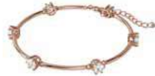
CONSTELLA BANGLE, M cod. SW5609711 - € 115.00

Ispirato alle meraviglie del cosmo, questo paio di orecchini asimmetrici sono formati da un'elegante linea di metallo placcato oro rosa tempestato di pietre taglio Brilliant montate a griffe. Reinterpretazione moderna del solitario, questi orecchini esemplificano la contemporaneità del classico; puoi indossarli di giorno, di sera, per valorizzare qualsiasi look con un tocco di polvere di stelle. Parte della famiglia Constella, questi orecchini sono firmati dal Direttore Creativo Giovanna Engelbert per la Collection I.