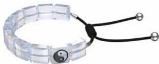
LETRA BRACELET YIN YANG cod. SW5614979 - € 65.00

Spruzza un po' di magia colorata sul tuo look quotidiano, con questi sensazionali orecchini a cerchio. I cristalli taglio Triangle tassellato sono racchiusi in una montatura della stessa tonalità, per creare una finitura a 360 gradi che non dimentica alcun dettaglio. Indossali con capi minimalisti, per un fascino da far girare la testa da ogni angolazione. Questi orecchini sono parte della famiglia Curiosa e sono firmati dal Direttore creativo Giovanna Engelbert per la Collection I.