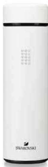
CRYSTAL THERMOS BOTTLE OTHERS cod. SW5560758 - € 29.00

In un mondo dove la praticità spesso si scontra con il rispetto per l'ambiente, ecco una soluzione sostenibile per un'abitudine quotidiana: una tazza riutilizzabile da 400 ml per caffè da asporto. Realizzata con fibra di bambù riciclata ed ecologica e con materiale di mais, è adatta sia per bevande calde che per bevande fredde. È disponibile in nero con un fine motivo a sfaccettature beige all'esterno, un coperchio in silicone e un manicotto antiscivolo per il trasporto di liquidi caldi decorato con cristalli. Mostrare al mondo che il suo futuro vi interessa. Dimensioni: 14,5x8,2ø cm