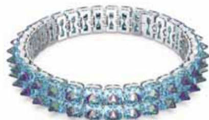
ORTYX CHOKER cod. SW5608903 - € 700.00

Dal design audace come un prisma destrutturato, questi orecchini a cerchio placcati rodio non passeranno inosservati. Sapientemente realizzati con cristalli blu dal taglio piramidale e Cushion, questo paio di orecchini esemplifica la bellezza e l'audacia. Indossali da soli per portare un tocco di vibrante colore e luccichio a semplici magliette, maglioni e felpe. Parte della famiglia Chroma, questi orecchini sono firmati dal Direttore Creativo Giovanna Engelbert per la Collection I.