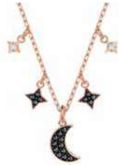
DUO MOON NECKLACE cod. SW5429737 - € 85.00

Una collezione di gioielli non sarebbe completa senza gli orecchini stud dal classico taglio Princess. Impreziosito da Clear Crystal e placcato rodio, questo meraviglioso paio di orecchini vanta un'eleganza naturale. Un ricordo senza tempo, che evoca un'estetica unisex ultra moderna. Non ti stancherai mai di indossarli.