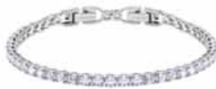
TENNIS ROUND BRACELET DELUXE, M cod. SW5409771 - € 155.00

Il charm per borsa sfoggia il cigno Swarovski esaltato dal pavé di cristallo e un cristallo proposto in un esclusivo taglio Swarovski, mentre il retro sfoggia il motivo Swanflower®. L'accessorio comprende inoltre una medaglietta Swarovski in acciaio, un fermaglio a moschettone e l'anello portachiavi riporta inciso il logo Swarovski. Un oggetto pratico e prezioso, che condensa tutto il fascino Swarovski! Misura: 9.6 x 3.2 x 0.8 cm.