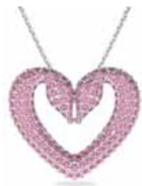
UNA PENDANT cod. SW5631931 - € 195.00

Questi accattivanti orecchini a cerchio di colore giallo intenso sono un esempio lampante di cristallo saturo di colore completamente sfaccettato. Questi orecchini sono una giocosa impresa ingegneristica, rifinita con una sottile chiusura a perno, indossabile con qualsiasi outfit: da elementi base neutri a una camicia bianchissima, a una maglietta e felpa con cappuccio per un tocco di lusso sportivo. Parte della linea Lucent, questi orecchini sono firmati dalla Direttrice creativa Giovanna Engelbert per la Collection II.