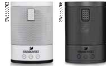
BLUETOOTH SPEAKER 2.0 cod. SW5560763 - SW5560766 - € 59.00

Perfetto per custodire oggetti di valore, lo splendido portagioie è decorato con diciotto cristalli Swarovski. Il suo design esclusivo offre tre scomparti con apertura orizzontale per soddisfare tutte le esigenze quotidiane, ed è un modo ispirato per dire "grazie" a colleghi e soci d'affari.