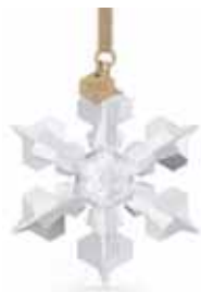
ANNUAL EDITION ORNAMENT 2022 cod. SW5615387 - € 65.00

La nostra amatissima tradizione delle Decorazioni Edizioni Annuali Swarovski proseguirà nel 2022 con questa splendida creazione in cristallo. Da una raffinata lavorazione con 170 sfaccettature, nasce un design a fiocco di neve in cristallo che offre una nuova interpretazione di un classico delle festività. Appeso a un nastro lamé color oro, il fiocco di neve è esaltato dalla placcatura in tonalità oro champagne. Disponibile unicamente nel 2022, ha una targhetta in metallo con l'incisione dell'anno, impreziosita da un piccolo cristallo. Decora un albero, appendilo a una finestra o mettilo in mostra in uno dei nostri eleganti Display per Decorazione di Natale o nelle Campane di Vetro. Oggetto decorativo. Non è un giocattolo. Non adatto a bambini di età inferiore ai 15 anni.