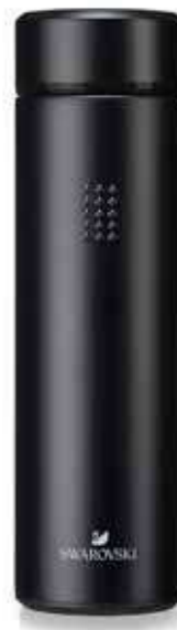
CRYSTAL THERMOS BOTTLE OTHERS cod. SW5560762 - € 29.00

È importante rimanere idratati senza aumentare l'enorme volume di plastica monouso che viene ad accrescere le montagne di rifiuti prodotte ogni giorno dalla nostra società. Ecco perché l'elegante thermos in acciaio inox Crystal è un'indispensabile compagna nella vita quotidiana che tutti apprezzeranno. Progettata per mantenere le bevande calde oppure fredde a seconda del bisogno, è pratica e robusta, con un filtro integrato come utile caratteristica per le tisane. Inoltre, l'elegante silhouette, impreziosita da 15 cristalli scintillanti e trasparenti, ne fa un accessorio di stile da portare nella borsa. Da notare il logo con il cigno Swarovski, rinomato marchio di qualità superiore.