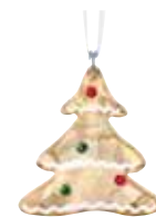
GINGERBREAD TREE ORNAMENT cod. SW5395976 - € 49.00

Questa Decorazione Campanella di Natale piccola di Swarovski è pronta per i magici rintocchi invernali. Una campana di vetro soffiato a bocca e realizzata a mano su un nastro di raso bianco rifinito contiene uno splendido battente in cristallo a forma di stella, che brilla con 231 scintillanti sfaccettature. La campana è impreziosita da circa 1.000 piccoli cristalli e numerosi cristalli a forma di stella che luccicano nell'atmosfera invernale. Dal momento che i cristalli sono applicati a mano, ciascuna campana è un pezzo unico, che ne fa un'aggiunta speciale ad ogni set di decorazioni e un'idea regalo deliziosa per ricordare le occasioni speciali. Oggetto decorativo. Non è un giocattolo. Non adatto a bambini di età inferiore ai 15 anni.