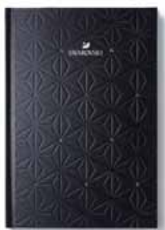
FACETS NOTEBOOK, BLACK cod. SW5531342 - € 29.00

Annotarsi qualcosa non è mai stato così glamour. La copertina del Notebook è decorata con un motivo composto da brillanti cristalli Swarovski. Presentato in una scatola bianca logata Swarovski, questo notebook è un regalo attraente e di alta qualità. 21 x 14,5 x 1,3 cm.