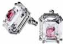
CHROMA PIERCED EARRINGS cod. SW5600627 - € 155.00

Singolare ma straordinariamente semplice, questa collana pendente conferirà un tocco di colore a qualsiasi look. Il suo design sovversivo presenta due cristalli sovrapposti dal taglio Octagon appesi a una collana sottile placcata rodio. Indossala con blocchi di colore per valorizzare le tonalità di rosa, aggiungendo gli orecchini abbinati della famiglia Chroma per un risultato di impatto. Parte della famiglia Chroma, questa collana è firmata dal Direttore Creativo Giovanna Engelbert per la Collezione I.