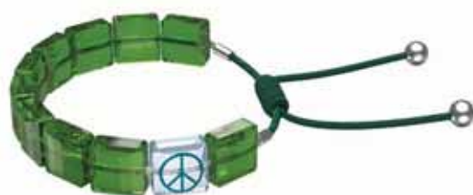
LETRA BRACELET PEACE cod. SW5615003 - € 65.00

Questo bracciale di cristallo è una moderna interpretazione dei tradizionali bracciali con bead e del loro simbolismo. Realizzato con cristalli bianchi taglio square e rifinito con un cordino regolabile in cotone cerato, ha lo yin yang stampato, simbolo di passione, prosperità e luminosità. Dona allegria e positività alla tua collezione di gioielli grazie a questo bracciale creato per rendere speciale la tua quotidianità. Parte della famiglia Letra, questo bracciale è ideato dalla Direttrice Creativa Giovanna Engelbert per la Collection II.