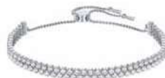
SUBTLE BRACELET, M cod. SW5221397 - € 115.00

Per molti anni, il bracciale Tennis è stato uno dei nostri modelli più popolari. Ora siamo onorati di presentare questa nuovissima versione con un tocco deluxe. Le pietre tonde sono montate a griffe, una tradizionale tecnica di alta gioielleria, che rende protagonista il loro brillante scintillio. Grazie alla sua eleganza senza tempo, il bracciale Tennis guadagna punti-stile in ogni occasione ed è una perfetta idea regalo. Abbinato a un bangle o a un orologio Swarovski per un fantastico look a sovrapposizioni.