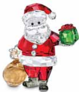
JOYFUL SANTA CLAUS WITH GIFT BAG cod. SW5539365 - € 185.00

Decorato con oltre 1500 cristalli Swarovski incastonati con la tecnica Crystal Rocks, questo contemporaneo portacandele in vetro scintilla luminoso con il nostro personale effetto Aurora Borealis. Certo di aggiungere scintillio ad ogni ambiente, creerà un'atmosfera glamour, di giorno e di sera. Il regalo perfetto per chi amate. Oggetto decorativo. Non è un giocattolo. Non adatto a bambini di età inferiore ai 15 anni.