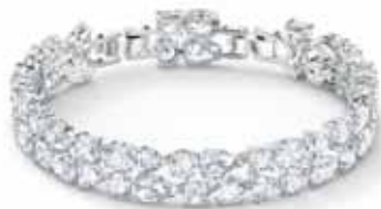
TENNIS BRACELET DELUXE MIXED, M cod. SW5562088 - € 250.00

Questo elegantissimo bracciale Swarovski sfoggia un'intramontabile bellezza. Due file di pietre bianche sfaccettate brillano luminose, alternando forme quadrate, a goccia e rotonde, con tagli ovali e Trillian raffinati, per un effetto assolutamente abbagliante. Con la chiusura a moschettone ripiegato, il bracciale si presta magnificamente agli abbinamenti con altri gioielli in coordinato, ideale per impreziosire ogni tuo look. Una splendida idea regalo.