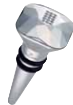
BOTTLE STOPPER cod. SW5531338 - € 35.00

La caraffa per l'acqua edizione Lime si distingue in ogni occasione, in sala da pranzo, in sala riunioni o alla festa in ufficio. Il suo look è leggero, fresco ed estivo, con uno scintillante design "spray" di 226 cristalli nell'elettrizzante gamma di colori degli agrumi peridoto, mandarino e citrino. Un regalo già indimenticabile, oltre che funzionale. Lavabile in lavastoviglie, è prodotto in Austria secondo gli standard più elevati. Notate il logo con il cigno Swarovski stampato sulla base come garanzia di qualità premium.