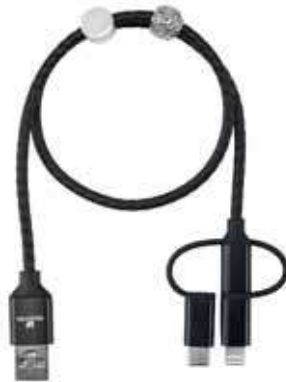
USB CHARGING CABLE cod. SW5434787 - € 29.00

Questa borsa shopper di alta qualità è la compagna perfetta per le spese di ogni giorno, oltre che un'eccellente idea regalo. Realizzata in cotone poliestere, presenta elementi statement delle collezioni di gioielli Swarovski. 40 x 35 cm.