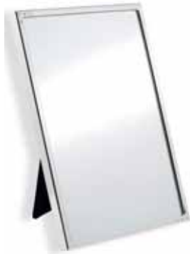
MIRROR cod. SW5428597 - € 19.00

Questo caricabatterie senza filo, con la sua elegante forma arrotondata, delicatamente messa in luce da 15 cristalli Swarovski, risponde perfettamente alla tendenza sempre più diffusa di regalare oggetti elettronici. Si conforma allo standard di ricarica rapida Qi-BPP/Samsung ed è compatibile con cellulari con tecnologia Qi. Tra le sue pratiche caratteristiche ricordiamo un logo LED con il cigno bianco che compare quando è in modalità stand-by e un anello LED che rimane illuminato per mostrare la corretta carica della batteria (lampeggerebbe qualora la ricarica non funzionasse). Dimensioni: 10 cm x 1 cm.