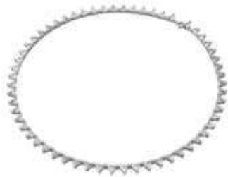
MILLENNIA ALL AROUND NECKLACE cod. SW5599191 - € 300.00

Realizzato per dare l'illusione di pietre fluttuanti, questo choker è un pezzo iconico che non può mancare nella tua collezione di gioielli. Con i classici cristalli taglio Cushion in una moderna montatura, questo gioiello versatile è perfetto sia di giorno che di sera, da solo o abbinato ad altri, per trasmettere un senso di mistero a qualsiasi look. Parte della famiglia Harmonia, questa collana è firmata dal Direttore Creativo Giovanna Engelbert per la Collection I.