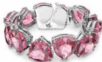
MILLENIA BRACELET cod. SW5609714 - € 400.00

Questa collana senza tempo rappresenta un elemento di classe in più per il tuo guardaroba quotidiano. Con i suoi voluminosi cristalli trasparenti taglio Trillion inseriti in un'elegante montatura placcata rodio, è un esempio splendido di temeraria semplicità. Indossala per valorizzare il colletto della camicia di giorno, oppure un abito raffinato la sera. Parte della famiglia Millenia, la collana è firmata dal Direttore creativo Giovanna Engelbert per la Collection I. Come chiuderla e aprirla: posizionare l'elemento di fissaggio nel punto più largo del foro opposto e farlo scorrere fino al punto più basso. Una volta posizionato, abbassare il fermo di sicurezza dell'anello a D sulla parte superiore per bloccare il fissaggio. Per aprire, sollevare il fermo di sicurezza dell'anello a D e far scorrere il testimone verso il punto più largo per sganciarlo.