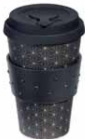
BAMBOO TRAVEL MUG cod. SW5531347 - € 29.00

In un mondo dove la praticità spesso si scontra con il rispetto per l'ambiente, ecco una soluzione sostenibile per un'abitudine quotidiana: una tazza riutilizzabile da 400 ml per caffè da asporto. Realizzata con fibra di bambù riciclata ed ecologica e con materiale di mais, è adatta sia per bevande calde che per bevande fredde. È disponibile in nero con un fine motivo a sfaccettature beige all'esterno, un coperchio in silicone e un manicotto antiscivolo per il trasporto di liquidi caldi decorato con cristalli. Mostrare al mondo che il suo futuro vi interessa. Dimensioni: 14,5x8,2ø cm