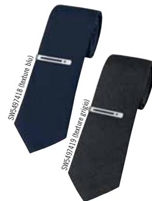
TIE WITH CLIP cod. SW5497418 - SW5497419 - € 55.00

Fate colpo regalando il nuovo e stilosissimo telo da spiaggia. Con un generoso diametro di 150 cm, questo asciugamano rotondo è realizzato in cotone 100% e presenta un motivo geometrico bianco e blu e una deliziosa frangia bianca. Trova posto in una custodia da trasporto decorata con quindici cristalli Swarovski®.