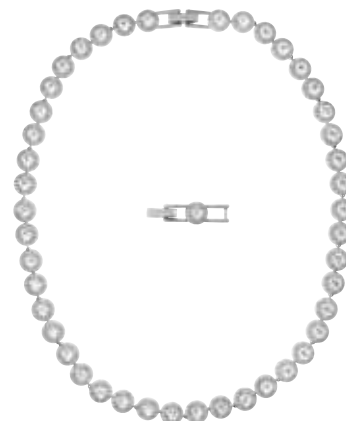
ANGELIC ALL-AROUND NECKLACE cod. SW5117703 - € 200.00

Semplice ma anche glamour, questo paio di ear cuff Swarovski sfoggia un'intramontabile design. Presentano pietre bianche luccicanti in varie forme chic, con tagli a goccia, quadrati, Trillian e rotondi, mentre le silhouette degli ear cuff si avvolgono con eleganza attorno ai lobi. Una brillante aggiunta ai tuoi outfit da tutti i giorni, questi orecchini sono perfetti da indossare insieme ad altri gioielli in coordinato. Un'idea regalo accattivante e di grande ispirazione.