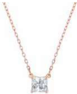
ATTRACT NECKLACE SQUARE cod. SW5510698 - € 65.00

Fondi eleganza e semplicità con la collana Attract. Intramontabile ed elegante, il design placcato nella tonalità oro rosa presenta una brillante pietra dal taglio quadrato. Ideale per ogni occasione, è un “must” immancabile in ogni collezione di gioielli e perfetta da regalare. Il gioiello è altamente armonizzabile con altre creazioni Swarovski.