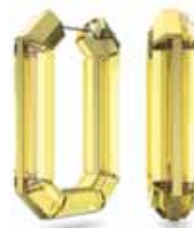
LUCENT HOOP EARRINGS cod. SW5633954 - € 300.00

Questi accattivanti orecchini a cerchio blu brillante sono un esempio lampante di cristallo saturo di colore completamente sfaccettato. Questi orecchini sono una giocosa impresa ingegneristica, rifinita con una sottile chiusura a perno, indossabili con qualsiasi outfit: da un semplice paio di jeans con maglietta a elementi base neutri o un maglione a collo alto. Parte della linea Lucent, questi orecchini sono firmati dalla Direttrice creativa Giovanna Engelbert per la Collection II.