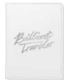
PASSPORT COVER BRILLIANT TRAVELER cod. SW5502274 - € 19.00

Questo beauty case con l'iscrizione "Brilliant Traveler" è essenziale per coloro che amano viaggiare con stile. Con la sua taglia di 16,5x10x6 cm, è maneggevole da trasportare, offrendo al contempo abbastanza spazio per tutto ciò di cui si ha bisogno. Fabbricato in pelle PU ultraleggera, questo astuccio per cosmetici impeccabilmente realizzato sfoggia una combinazione di colori in grigio e bianco e una deliziosa fodera "Swan flower". All'interno si trova una pratica pochette per disporre oggetti piccoli o fragili. Un regalo utile e di tendenza.