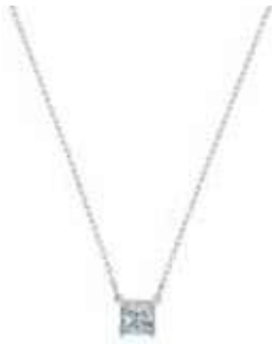
ATTRACT NECKLACE SQUARE cod. SW5510696 - € 65.00

Fondi eleganza e semplicità con la collana Attract. Intramontabile ed elegante, il design rodiato presenta una brillante pietra dal taglio quadrato. Ideale per ogni occasione, è un "must" immancabile in ogni collezione di gioielli e perfetta da regalare. Il gioiello è altamente armonizzabile con altre creazioni Swarovski.