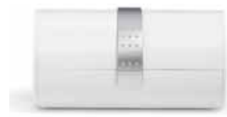
WATCH HOLDER BOX cod. SW5276646 - € 19.00

Con il Notebook nero vi farete notare ad ogni riunione. La copertina presenta un caratteristico motivo di cristalli Swarovski. Questo notebook è di dimensioni compatte – perfetto per essere infilato in una tasca o in una borsa. Prodotto di alta qualità, viene presentato in una scatola bianca logata Swarovski. 21 x 14,5 x 1,3 cm.