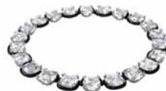
HARMONIA ALL AROUND NECKLACE cod. SW5600942 - € 400.00

Questo bracciale rigido è realizzato con una fila di cristalli oversize taglio cushion, finemente posizionati su una montatura nera in stile scultoreo che regala l'illusione di pietre fluttuanti, creando un design che rende omaggio alla vera essenza di Swarovski, fatta di magia e perfezione geometrica dei suoi cristalli. Indossalo a pelle sul polso o sopra una manica lunga per regalarti un look unico, di rara eleganza. Parte della famiglia Harmonia, il bracciale rigido è firmato dal Direttore Creativo Giovanna Engelbert per la Collection I.