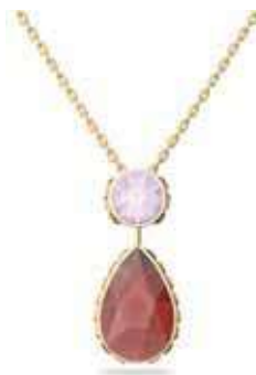
ORBITA NECKLACE cod. SW5619786 - € 125.00

Questi orecchini a buco, ideali da indossare ogni giorno, rappresentano la nuova direzione intrapresa dall'iconico emblema del cigno Swarovski. Questo paio a forma di cuore, placcato in tonalità oro rosa è pensato per scatenare l'immaginazione con gli sfavillanti cristalli pavé. Il regalo ideale per una persona amata, o magari per te. Parte della famiglia Una, questi orecchini sono ideati per la Collection III.