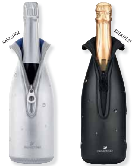
CHAMPAGNE COOLER cod. SW5231602 - SW5428595 - € 24.00

Festeggiate i vostri momenti speciali con questo attualissimo porta-champagne in neoprene, elegantemente decorato con cristalli Swarovski. Dimensioni: 9x31 cm.