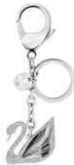
SWAN PAVÉ BAG CHARM & KEYRING cod. SW5201631 - € 79.00

Il bracciale tennis è un classico intramontabile e un gioiello da polso ideale per tutti, non solo per chi gioca a tennis! Chi indossa Emily - un bracciale rodato con cristalli e maglie a coppa e chiusura di sicurezza - renderà scintillante ogni look. Il monile è dotato di un elemento prolunga. Lunghezza: 17,5 cm.