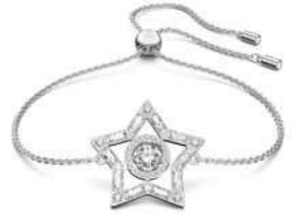
STELLA BRACELET cod. SW5617881 - € 135.00

Questa collana a Y di Swarovski è la scelta ideale per l'eleganza da tutti i giorni. Presenta una catenina placcata nella tonalità oro rosa, intrecciata in un simbolo dell'infinito tempestato di pietre scintillanti. Un'unica pietra alla fine della catenina aggiunge uno straordinario tocco finale. Un'idea regalo affascinante per qualsiasi occasione.