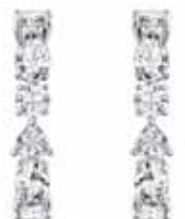
TENNIS PIERCED EARRINGS DELUXE MIXED cod. SW5563322 - € 85.00

Questo elegantissimo bracciale Swarovski sfoggia un'intramontabile bellezza. Due file di pietre bianche sfaccettate brillano luminose, alternando forme quadrate, a goccia e rotonde, con tagli ovali e Trillian raffinati, per un effetto assolutamente abbagliante. Con la chiusura a moschettone ripiegato, il bracciale si presta magnificamente agli abbinamenti con altri gioielli in coordinato, ideale per impreziosire ogni tuo look. Una splendida idea regalo.