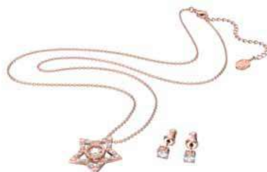
STELLA SET cod. SW5622730 - € 195.00

Eleganza discreta per il pendente che alterna metallo lucido placcato oro rosa e pavé di Clear Crystal. Il raffinato profilo a cerchi intrecciati si presta per qualunque occasione, e la sua brillantezza soffusa è una vera e propria dichiarazione di stile contemporaneo. Il pendente misura 1 x 1,5 cm ed è abbinato ad una catenina placcata oro rosa di 42 cm. Il gioiello è altamente armonizzabile con altre creazioni Swarovski.