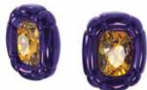
DULCIS CLIP EARRINGS cod. SW5613729 - € 175.00

Questa divertente collana pendente riprende la scultura del movimento della Pop Art, ed è sapientemente formata da un singolo cristallo in taglio di precisione inserito in una montatura a stampo viola lucida, appeso a una delicata catena in metallo dalla stessa tonalità. Indossala da sola con una semplice maglietta bianca oppure abbinala ad altre collane della famiglia Dulcis per un deciso tocco rosa candy. Parte della famiglia Dulcis, questa collana è firmata dal Direttore Creativo Giovanna Engelbert per la Collection I.