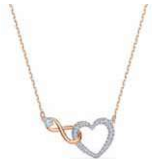
INFINITY NECKLACE HEART cod. SW5518865 - € 125.00

Questo set di gioielleria senza tempo è un must per ogni guardaroba moderno. L'iconico emblema della stella, che si ispira al paesaggio austriaco, costituisce l'elemento centrale della collana, splendidamente abbinata a un paio di scintillanti orecchini a lobo, entrambi in un'elegante montatura placcata in tonalità oro rosa. Un regalo per te o una persona cara, o magari per entrambi. Questo set della linea Stella è firmato dalla Direttrice creativa Giovanna Engelbert per la Collection II.