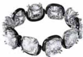
HARMONIA BRACELET cod. SW5600047 - € 300.00

Questi voluminosi orecchini a lobo sono realizzati con cristalli trasparenti taglio Cushion con montatura sospesa a griffe, per realizzare un illusorio effetto fluttuante. Intramontabili e ultramoderni al tempo stesso, puoi indossarli con capi athleisure per il giorno, oppure su abiti da sera eleganti: tocca a te decidere. Questi orecchini sono parte della famiglia Harmonia e sono firmati dal Direttore creativo Giovanna Engelbert per la Collection I.