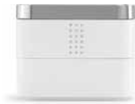
JEWELRY BOX cod. SW5276627 - € 29.00

Disegnato per valorizzare ogni riflesso e per completare ogni stile di arredamento, questo specchio presenta un'elegante bordatura ornata di cristalli Swarovski pieni di luce. Quattro cristalli sono inseriti nella parte superiore sinistra e nella parte inferiore destra della cornice in acciaio inossidabile lucente rivestita di velluto nero che trasmette un'impressione di vero lusso. Questa cornice misura 18,7 x 13,7 x 1,4 cm e può essere disposta sia orizzontalmente sia verticalmente, facendo di ogni specchiera, di ogni banco di negozio o di ogni scrivania un pezzo dal carattere ultra elegante.