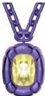
DULCIS PENDANT cod. SW5610290 - € 155.00

I colori della scatola di caramelle contrastano con le forme di ispirazione Pop Art in questi orecchini a lobo. I singoli cristalli in taglio di precisione sono inseriti in montature a stampo verde lucido, per un tocco inaspettato e divertente. Aggiungi un pizzico di giocosità a qualsiasi look indossandoli da soli, oppure libera la tua creatività e indossali con altri pezzi della famiglia Dulcis. Parte della famiglia Dulcis, questi orecchini sono firmati dal Direttore Creativo Giovanna Engelbert per la Collection I.