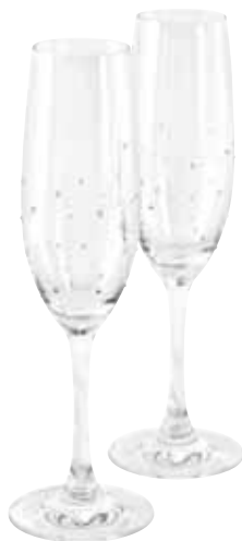
SPARKLING WINE GLASS, SET OF 2 cod. SW5493772 - € 49.00

In questo elegante oggetto, lo stile classico incontra quello moderno. Regalo perfetto per un cliente o per un amante del vino. Il suo design impedisce la fuoriuscita degli aromi e delle bollicine. Realizzato in acciaio inossidabile per garantire la conformità agli standard alimentari, tollera il caldo e il freddo, la sua superficie superiore ha la forma di uno dei cristalli Swarovski più venduti, ed è rifinito con file di cristalli e con il logo del cigno Swarovski inciso al laser.