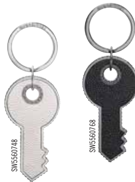
LEATHER KEY RING cod. SW5560748 - SW5560768 - € 35.00

La versione lusso del portachiavi ad anello in pelle è semplice e minimalista, prova di un lavoro artigianale e di uno stile sempre perfetti. La fibbia è in pelle di vitello nera di alta qualità alla quale si combina un brillante elemento a forma di rete ornato da 12 cristalli Swarovski in tinta jet. L'anello stesso è in acciaio inossidabile liscio, su cui è inciso al laser il logo con il cigno Swarovski.