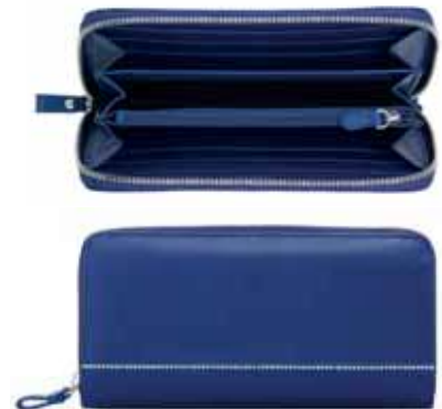
CLASSIC WOMAN WALLET cod. SW5186956 - € 144.00

La più raffinata pelle di vitello italiano tagliata a forma di chiave e incorniciata da una placcatura in rodio tempestato di cristallo, trasforma un oggetto semplice e pratico in un accessorio di stile estremamente ambito. Il portachiavi in pelle è un regalo aziendale ideale per colleghi e dipendenti, soprattutto quando viene offerto come segno di fiducia, come un gesto che suggerisce "la chiave del successo", per simboleggiare il raggiungimento di un traguardo importante, per celebrare una promozione, o per rappresentare la liberazione del potenziale.