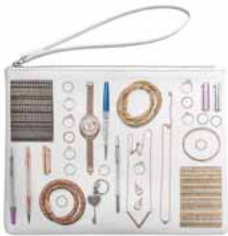
EVERYDAY POUCH WITH MARGARET ZHANG PATTERN cod. SW5247181 - € 29.00

Realizzato in pelle PU, il motivo è disegnato dalla famosa blogger e influencer globale Margaret Zhang e presenta elementi statement delle collezioni di gioielli Swarovski. 21 x 15 x 1,5 cm