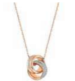
FURTHER PENDANT, S cod. SW5240525 - € 115.00

L'iconico emblema della stella forma il motivo centrale di questo delicato bracciale, ispirato alla magia del paesaggio austriaco. Rifinito con dettaglio Dancing Stone, questo oggetto è un'interpretazione contemporanea di una ricca tradizione della gioielleria. Indossalo da solo o con gli orecchini e il pendente coordinati della linea Stella. Parte della linea Stella, questo bracciale è firmato dalla Direttrice creativa Giovanna Engelbert per la Collection II.