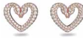
UNA STUD EARRINGS cod. SW5628659 - € 155.00

Questo pendente a cuore, che esprime tutta la bellezza della natura con la sua doppia figura di cigno, è il simbolo del potere dell'amore eterno, ma anche di un nuovo inizio per l'emblema del cigno Swarovski. È composto da raffinati cristalli pavé in una spettacolare tonalità rosa ed è montato su una catena placcata rodio. La scelta ideale per esprimere uno statement di allegria, di giorno o di sera. Parte della famiglia Una, questo pendente è ideato per la Collection III.