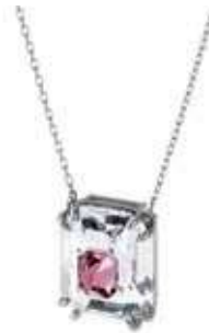
CHROMA NECKLACE cod. SW5608647 - € 125.00

Questa collana Swarovski è assolutamente trendy. La collana si chiude sul davanti con un'elegante chiusura con barra a T, mentre l'elemento centrale può essere capovolto per creare due stili diversi. È decorata da una moneta, ricoperta su un lato di pavé di Clear Crystal. Ideale per impreziosire gli outfit casual, da tutti i giorni, e perfetta per i look trendy con sovrapposizioni in layering di altri gioielli.