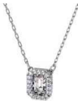
MILLENNIA PENDANT cod. SW5599177 - € 125.00

Questa collana è progettata con la massima precisione, è realizzata con una linea uniforme di pietre trasparenti taglio Triangle Step. Le pietre sono montate su una catena placcata in tonalità argento e la collana si completa con una chiusura ad aragosta. Questo gioiello è l'ideale per accompagnarti sempre e ovunque, praticamente, la collana di riferimento per un'eleganza intramontabile, giorno e notte. Parte della famiglia Millennia, la collana è firmata dal Direttore Creativo Giovanna Engelbert per la Collection I.