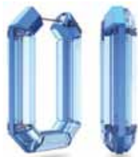
LUCENT HOOP EARRING cod. SW5633950 - € 300.00

Questi accattivanti orecchini a cerchio blu brillante sono un esempio lampante di cristallo saturo di colore completamente sfaccettato. Questi orecchini sono una giocosa impresa ingegneristica, rifinita con una sottile chiusura a perno, indossabili con qualsiasi outfit: da un semplice paio di jeans con maglietta a elementi base neutri o un maglione a collo alto. Parte della linea Lucent, questi orecchini sono firmati dalla Direttrice creativa Giovanna Engelbert per la Collection II.